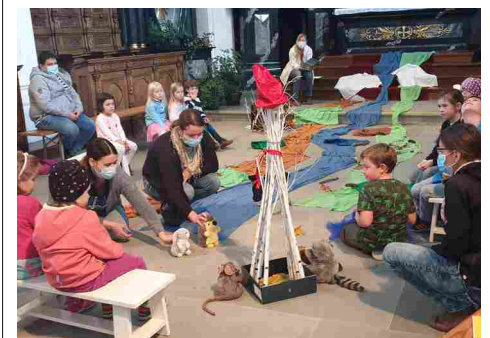
Der kleine Igel auf dem Weg