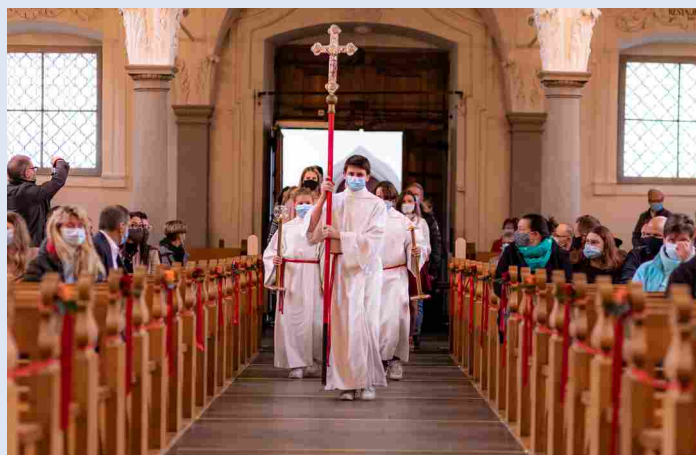
Einzug in die Kirche

Mit Maske und dem vorgeschriebenen Abstand zogen die Firmanden und Firmandinnen in die Kirche ein. Auch innerhalb der Kirche wurden die Abstände und sonstigen Schutzmassnahmen von den Gästen eingehalten.