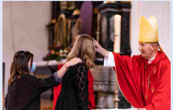
Empfang der Firmung durch Salbung mit Chrisam

Einige Wochen vor der Firmung fand aber noch eine verkürzte Fassung des Patennachmittags statt. Dies war der erste Termin, bei welchem die Paten auch dabei waren. Am 17. Oktober um 15 Uhr war es dann, trotz neuen Schutzmassnahmen, möglich, die Firmung zu feiern.