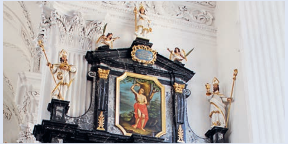
Die 3 oberen Statuen des rechten Seitenaltars.

Für den Heiligen Benedikt bestand in Arth ein sogenanntes «Translationsfest», dass die Übertragung seiner Reliquien commemoriert.