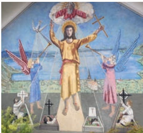
Bildnis vom Friedhof, Arth

Ein ewiges Licht soll dem Verstorbenen, auch noch am Tag danach, an Allerseelen, Licht spenden.