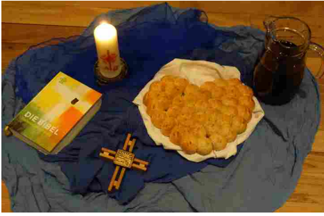
Symbole der Eucharistie

Am 22. Januar waren die Erstkommunion-Eltern zum zweiten Elternabend eingeladen. Mit dem Film «Die Kommunion» wurde aufgezeigt, was das Sakrament der Eucharistie bedeutet und die Eltern erhielten einige Informationen rund um die Erstkommunion. Die Eltern gestalteten für ihr Kind auch eine Kerze, welche sie auf dem Vorbereitungsweg begleiten soll.