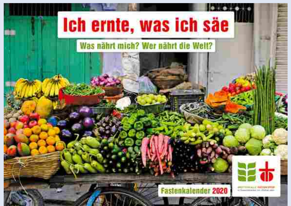
Der Fastenkalender: Ihr Begleiter durch die 40tägige Vorbereitungszeit auf Ostern