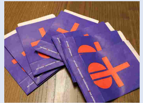
Die Fastenopfer-Säckli sind bereit für den Versand