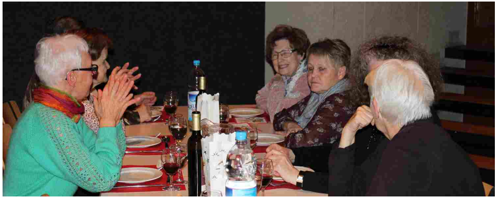
Treue Helferinnen am letztjährigen Anlass