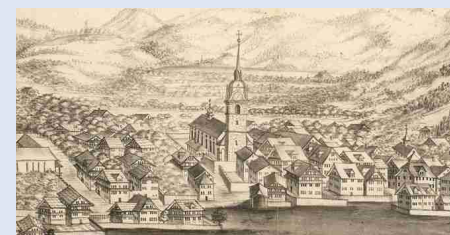
Unsere Pfarrkirche anno dazumal

Der Anlass ist kostenlos, eine Anmeldung ist nicht erforderlich. Pfarrei Arth