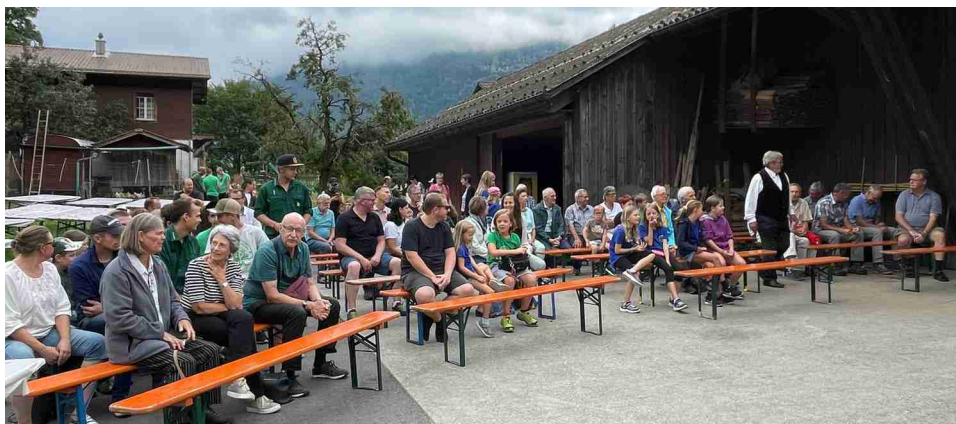
Die versammelte Gemeinde am Pfarrefest