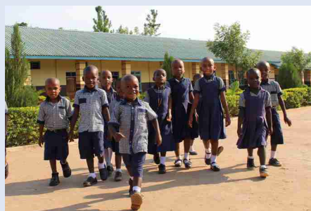
Schüler der De Paul Missionsschule

Im Moment haben wir bereits die Hälfte der benötigten Fr. 15'000.-.