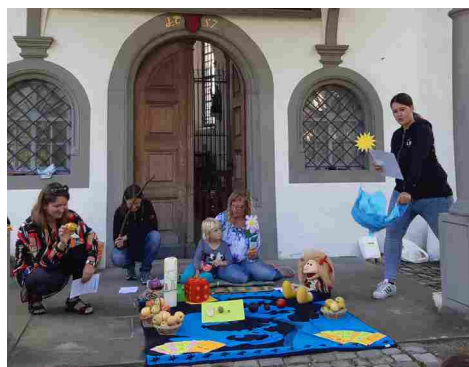
Das Chlichinderfiir-Team gibt vollen Einsatz

Am Samstag, 12. September wurde mit den Kleinen (2 - 6 Jahre) bei der Kapelle St. Georg Erntedank gefeiert. Das Chlichinderfiir-Team hatte eine Geschichte vorbereitet. Darin erzählte ein Apfel von Blüten, die sich wunderten wie sie denn zu Äpfeln werden sollten.